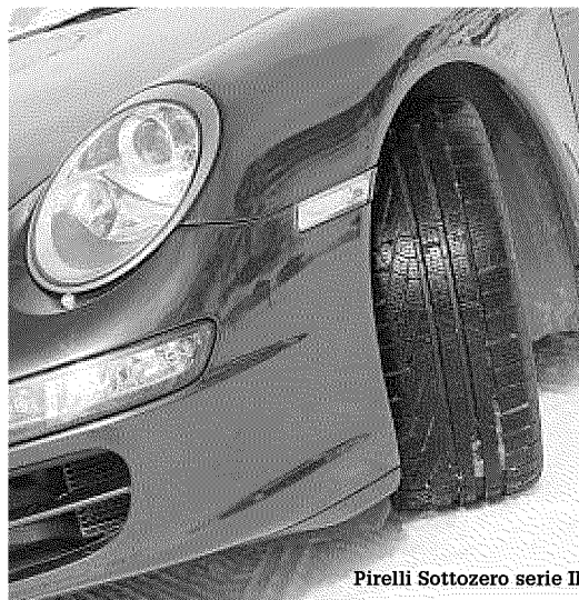
Pirelli Sottozero serie II

Molti rivenditori offrono al costo di pochi euro il servizio di ricovero e di corretta conservazione per il treno di gomme non in uso con una completa copertura assicurativa. Per maggiori informazioni: www.pneumaticisottocontrollo.it