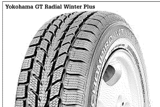
Yokohama GT Radial Winter Plus