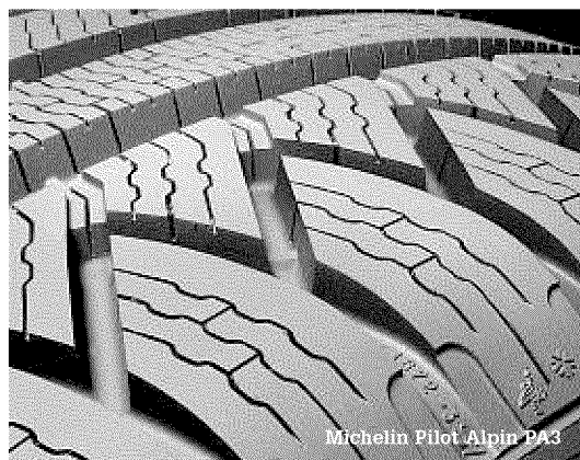
Michelin Pilot Alpin PA3